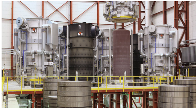
Kaltwalzwerk: H 2 -Hochkonvektions-Haubenglühanlage