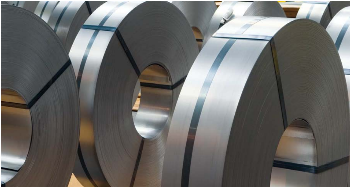
Kaltwalzwerk: Versandfertiges Kaltband