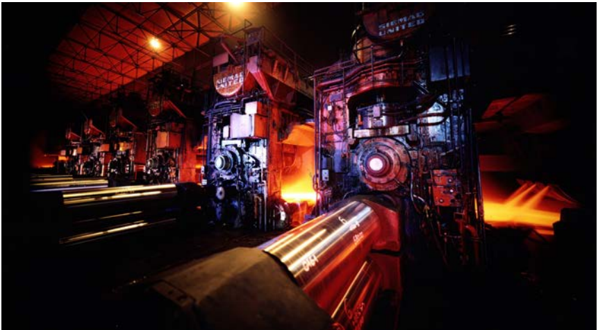
Warmwalzwerk: Mehrgerüstige Fertigstaffel

Darüber hinaus kann jede beschädigte oder feststehende Transportrolle des Rollgangs zu Beschädigungen des heißen und damit empfindlichen Vorbands führen, welche später als Schalen auffällig werden.