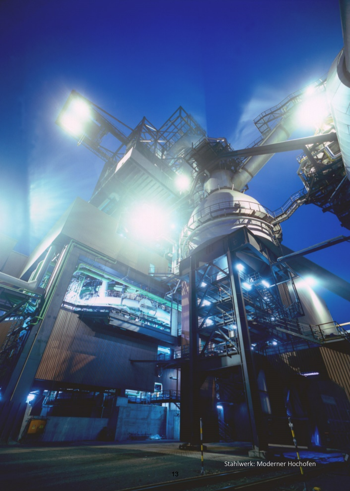
Stahlwerk: Moderner Hochofen